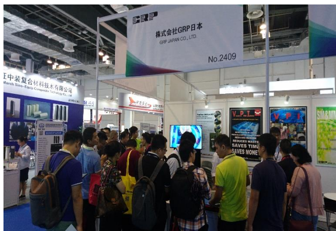
展示会場の写真（常に満員状態でした）

～予想以上に反響をいただき、弊社員の対応が追い付かずご満足いただけのご説明が出来なかった事をお詫び申し上げます。 中国市場においても環境問題は深刻でVPIに大きな期待を寄せられている事を実感した3日間でした。～